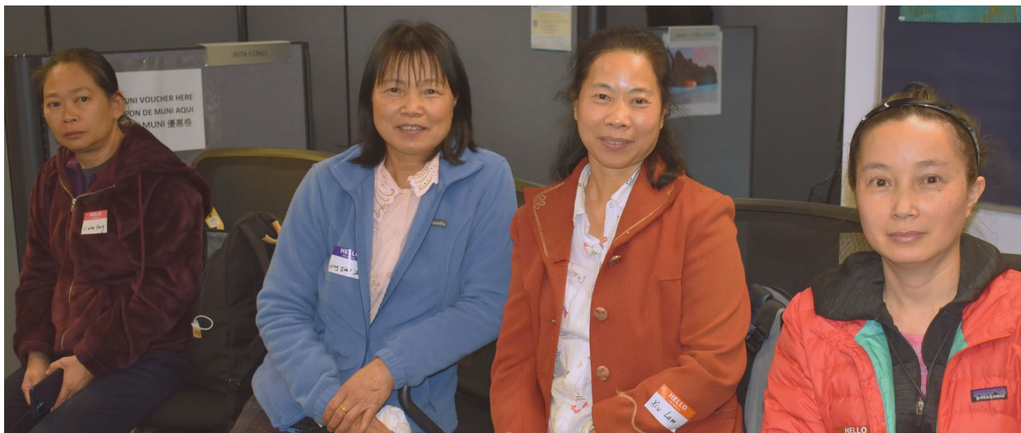
旧金山 IHSS 公共机构后备提供商

他们愿意以善良、关怀和可靠性服务雇主，真正使他们脱颖而出。如果你有兴趣为 IHSS 雇主者提供必要的服务，请点击链接提交申请。